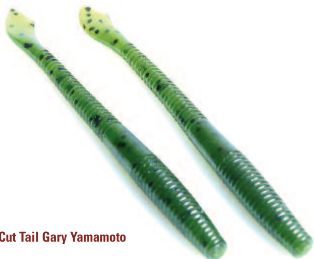
Cut Tail Gary Yamamoto

Pour le shaking rig, on gagne souvent à prendre un leurre sensiblement de la même couleur que le fond. Les modèles avec une queue chartreuse peuvent être intéressants quand l'eau est un peu trouble. En cas d'hésitation, les coloris watermelon et pumpkinseed marchent toujours.